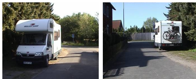
Übernachtung im WoMo in der Zufahrtsstraße

12.Tag Sam.10.05. Fahrt vom Steinhuder Meer über Hildesheim nach Dinklar zur Familienfeier.