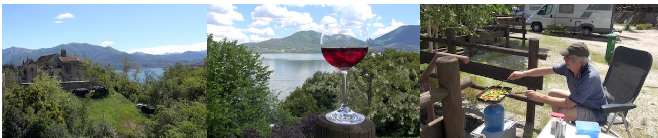
Vorn: Trollinger / Hinten: Lago Maggiore

Oggebbio ist die topographische Bezeichnung für 15 Dörfchen, die verstreut in den Bergen bis hinunter zum Seeufer liegen. Etwa. 200m oberhalb vom SP ist das alte Dörfchen Gonte mit einem „Tante Emma Laden“, einer Bar und einem Restaurant. Es ist auch Ausgangspunkt von tollen Rundwanderwegen, wir entschieden uns für den Panoramaweg zu den nächsten Ortschaften, immer mit Blick auf den Lago.